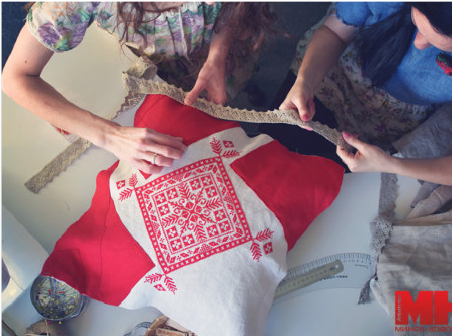
За что вышивальщицы любят лен: фоторепортаж из мастерской