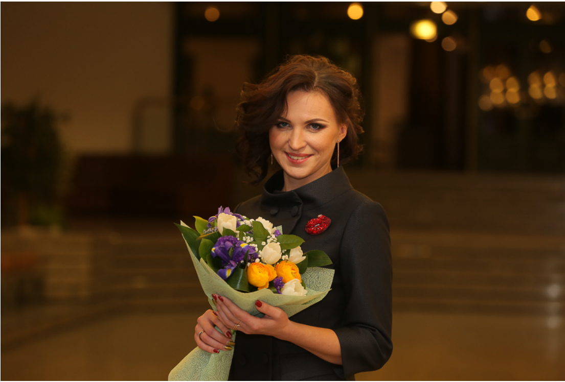
Завершился праздник концертом артистов белорусской эстрады.