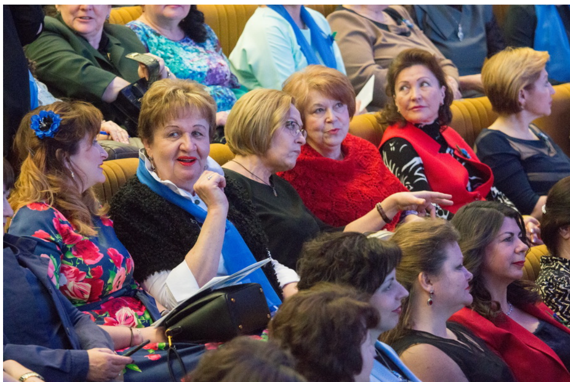
На церемонии собрались представительницы самой массовой в стране женской организации – ОО «Белорусский союз женщин». Он объединяет более 183 тыс. участниц. Мам, сестер, дочерей – всех тех, кто дарит жизнь, несет гармонию и красоту, создает уют и заботится о ближних.