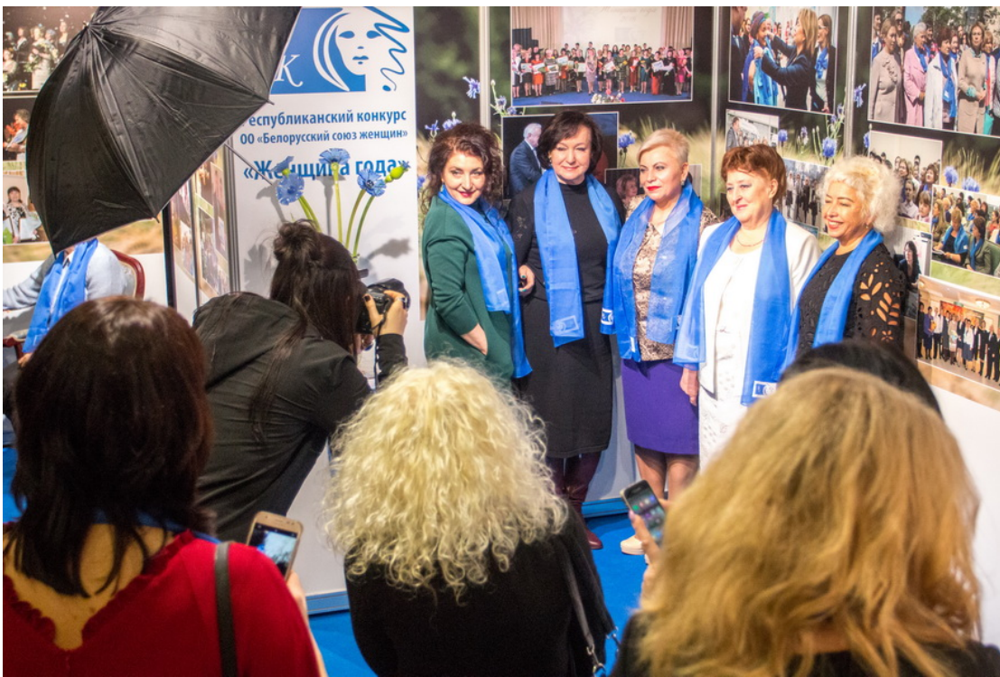
В Малом зале Дворца Республики царил праздничная атмосфера. В фойе развернулась фотовыставка, рассказывающая о Белорусском союзе женщин. У фонтана разместилась живая композиция, олицетворяющая красоту Синеокой.